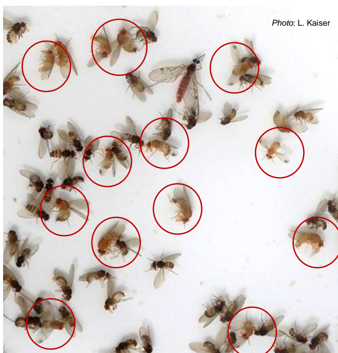
Diversité des motifs d'ailes de drosophiles

Seule cette aile de drosophile appartient à D. suzukii mâle