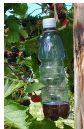
Hausgemachte Falle : PET-Flasche