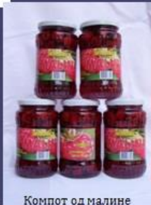
Компот од малине