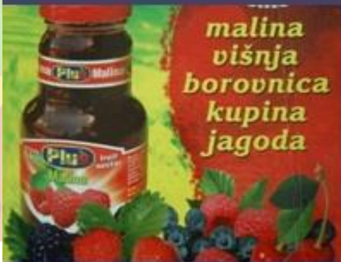
Сок од малине