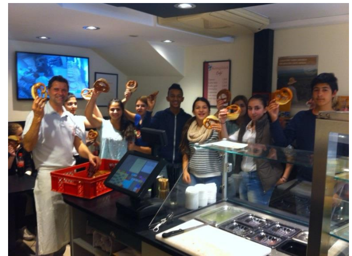
Backen mit Schulklassen