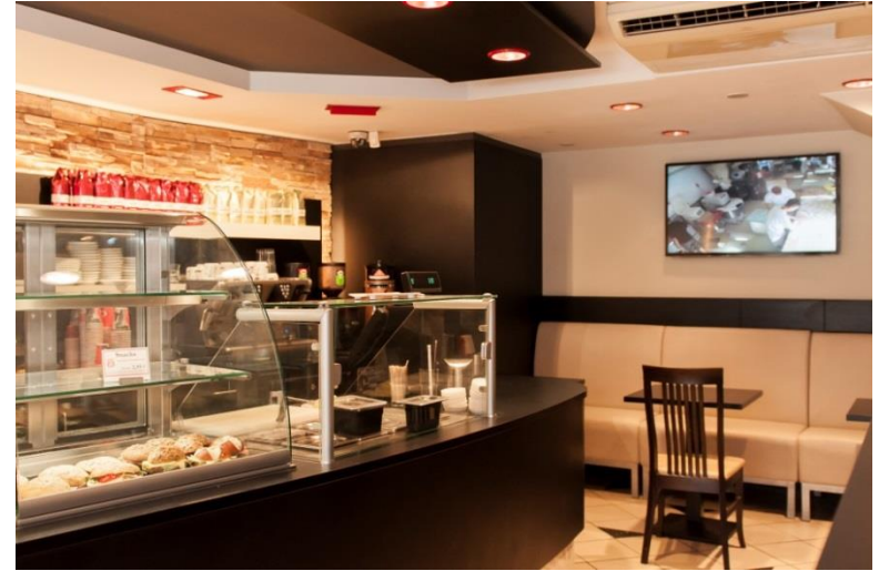
Übertragungsmonitor in die Backstube