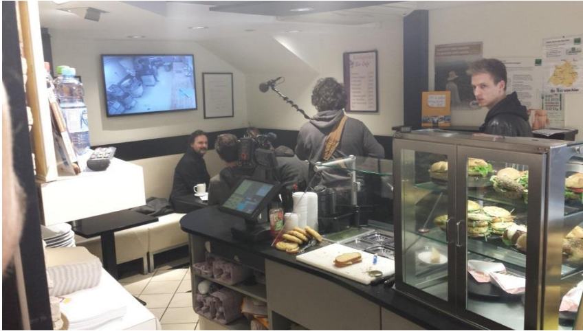
Besuch des Fernsehens